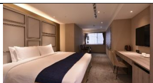
經典大床/雙床房(有窗、9.5 坪)