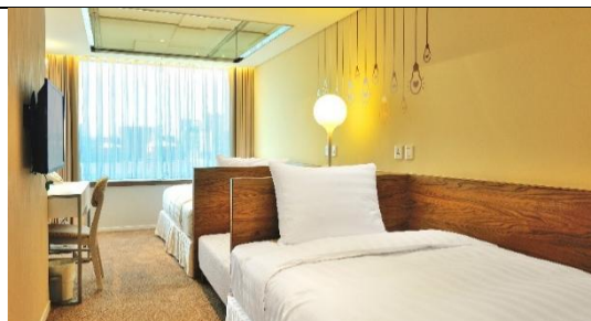
高級市景雙床房(無浴缸、8 坪)