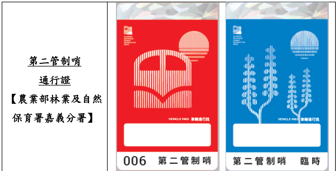
圖1 阿里山森林遊樂區通行證式樣

(三)台18線小型車停車轉乘方式：61k 樂野服務區（含後方空地）提供民眾停車轉乘使用；疏運轉乘專車上下客地點為樂野服務區小木屋處，另停在後方空地之民眾，由農業部林業及自然保育署嘉義分署派遣1台中型巴士（並視需要機動彈性增至2台），負責免費接駁至樂野服務區，再搭乘疏運轉乘專車上山。回程再負責載運至原接駁點取車。相關轉乘動線示意圖如圖2。